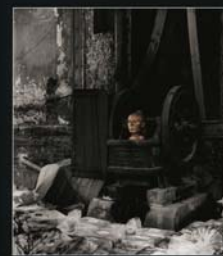
Salon de la Photographie